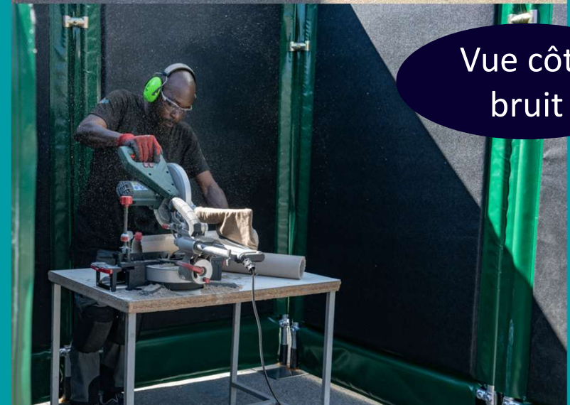
Vue côté bruit