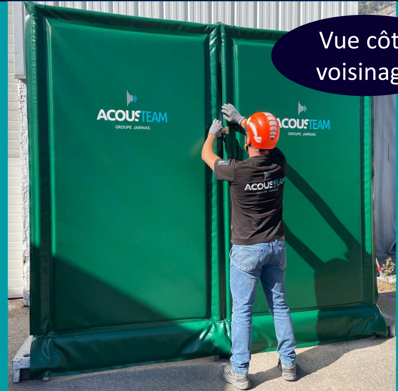
Vue côté voisinage